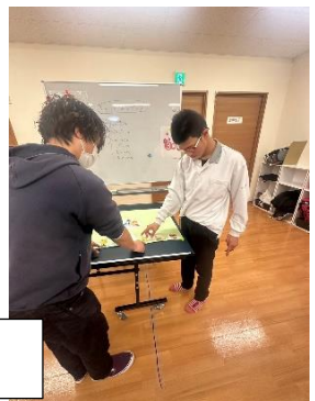
創作活動(壁面づくり)