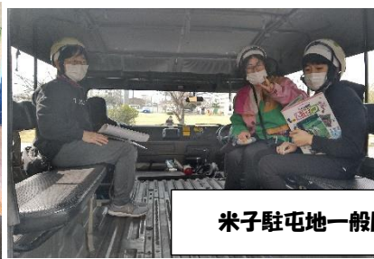
米子駐屯地一般開放(米子)