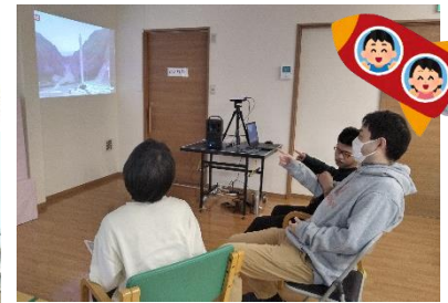
カイロス発射のライブ配信!