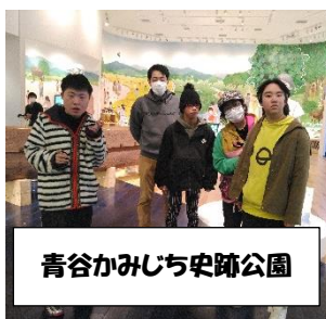
青谷かみじち史跡公園