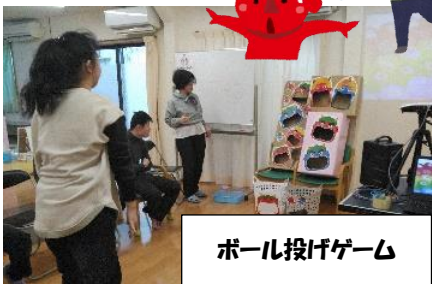
ボール投げゲーム